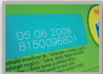
Крашенная бумага / картон