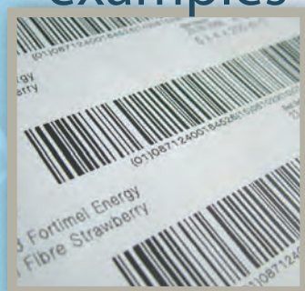
Термочувствительная этикетка |